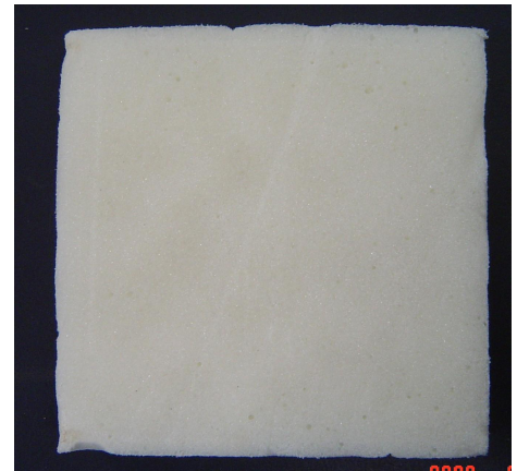
試験後のフォーム（放置12日後）